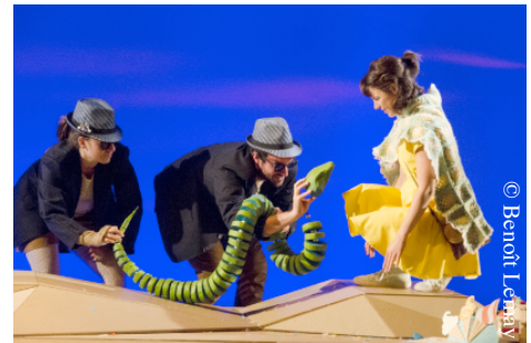
MON PETIT PRINCE

Producteurs : Théâtre du Gros Mécano et Théâtre de la Petite Marée Texte : Anne-Marie Olivier et Marie-Josée Bastien Mise en scène : Marie-Josée Bastien