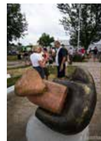
Michel Saulnier. Rencontres , 2012. Place du Citoyen. (Rue Forget)