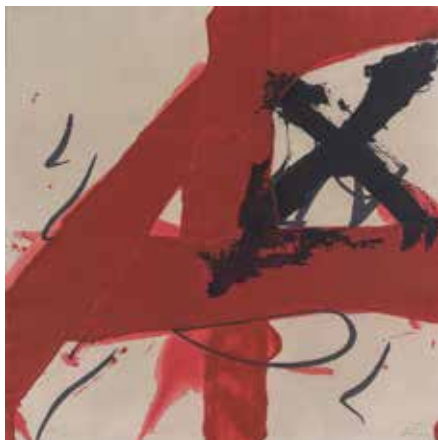
Antoni Tàpies. A4, 1985. Eau-forte (69/99). 75 x 75 cm. Collection MACBSP.

Compatriote de Picasso, Dalí et Miró, Antoni Tàpies est l'un des artistes catalans les plus importants de sa génération. L'exposition met en lumière l'originalité des techniques d'expression graphiques de son œuvre, qui comprend au total plus d'un millier d'estampes et de livres illustrés. Les œuvres sélectionnées illustrent ses principales préoccupations ; elles évoquent sa Catalogne natale et son intérêt pour l'être humain, qui est suggéré par les représentations et empreintes du corps, de même que par les objets usuels qui l'accompagnent.