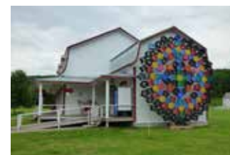
Philippe Allard. Transition , 2013. Laiterie Charlevoix.