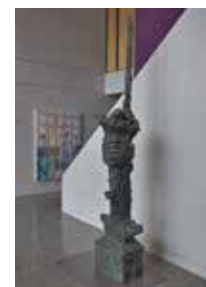
Jean-Paul Riopelle. Le Poisson , 1974. MACBSP.