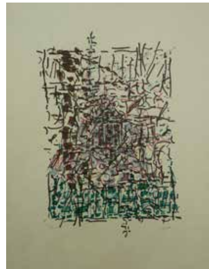
Jean-Paul Riopelle. Clocher caché , 1985-89. Lithographie (28/75). 57 × 78 cm.

Procurez-vous le catalogue de l'exposition La révolution Borduas , en vente à la boutique de Musée et prenez le temps de bouquiner dans notre sélection de livres d'art.