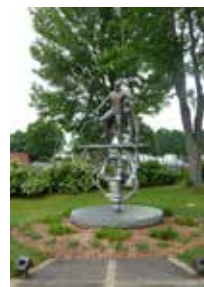
White & White. BleuCycle , 2012. Rue Racine. (Face au nouvel hôpital)

Le Musée partage sa collection de sculptures avec la communauté en présentant des œuvres dans différents lieux publics de la ville, permettant ainsi aux citoyens et aux visiteurs d'apprécier l'art contemporain.