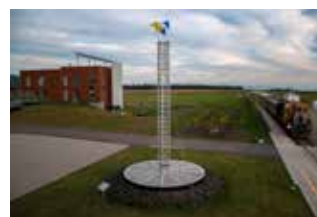
René Derouin. Le Phare , 2009. Hôtel et Spa Le Germain Charlevoix.